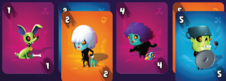
Příklad sbírky před hráčem

Nechte si místo pro balíček vytvořených hord.