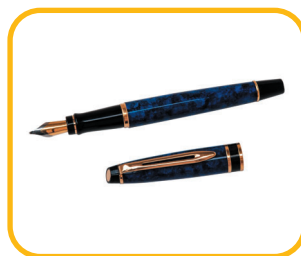
PLNICÍ INKOUSTOVÉ PE O