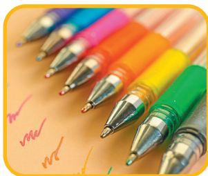
GE OVÉ PERO