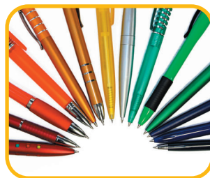
KULIČ OVÉ PERO