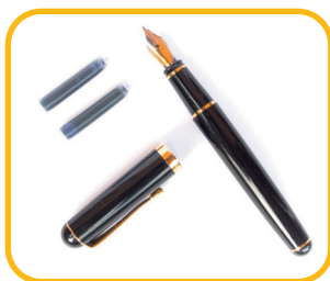
BOMBIČKO É PERO

! U obrázků jsou slova, ve kterých chybí písmeno. Chybějící písmena vypisuj postupně na linku.