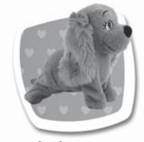
Povel: "HRABEJ" Popis: Hraje zadníma nohama. / Hraje zadnými.