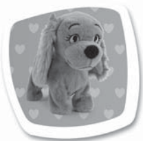
Povel: "VSTAŇ" Popis: Postaví se na všechny čtyři. / Postaví sa na všetky štyri.