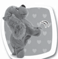
Povel: "POPROS" Popis: Postaví se na zadní a zatřepe hlakama. / Postaví sa na zadné a zatřepe labkami.