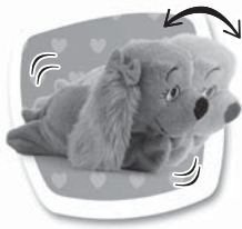
Povel: "TANCUJ" Popis: Tančí. / Tancuje.