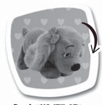
Povel: "NAJEZ SE" Popis: Sehne se a předstírá krmení. / Zohne sa a predstiera krmienie.