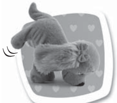
Povel: "POSTAV SE NA PŘEDNÍ" Popis: Postaví se na přední a zatřepe nohama. / Postaví sa na predné a zatřepe labkami.