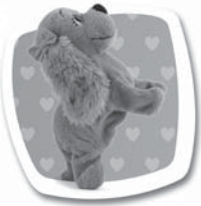
Povel: "DEJ MI PUSU" Popis: Postaví se na zadní a dá pusku. / Postaví sa na zadné a dá pusku.