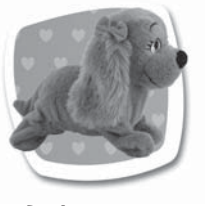
Povel: "HRAJ SI" Popis: Sehne se a předstírá krmení. / Podíde vpřed.