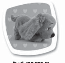
Povel: "HLEDEJ" Popis: Skloní hlavu a čenichá. / Skloní hlavu a čmúchá.