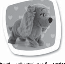
Povel - oslovení: např. "LUCY!" Popis: Postaví se do pozoru a radostně šteká. / Postaví sa do pozoru a radostne šteká.