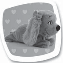
Povel: "LEHNI" Popis: Lehne si. / Lahne si.