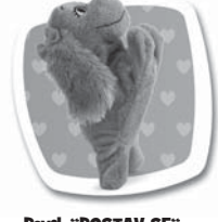
Povel: "POSTAV SE" Popis: Postaví se na zadní. / Postaví sa na zadné.