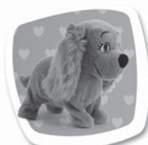
Povel: "ŠTEKEJ" Popis: Šteká. / Šteká.