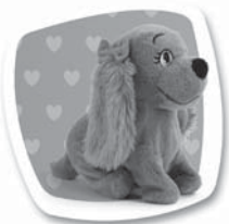
Povel: "SEDNI" Popis: Sedne si. / Sadne si.