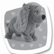
Povel: "AHOJ" Popis: Zašteká. / Zašteká.